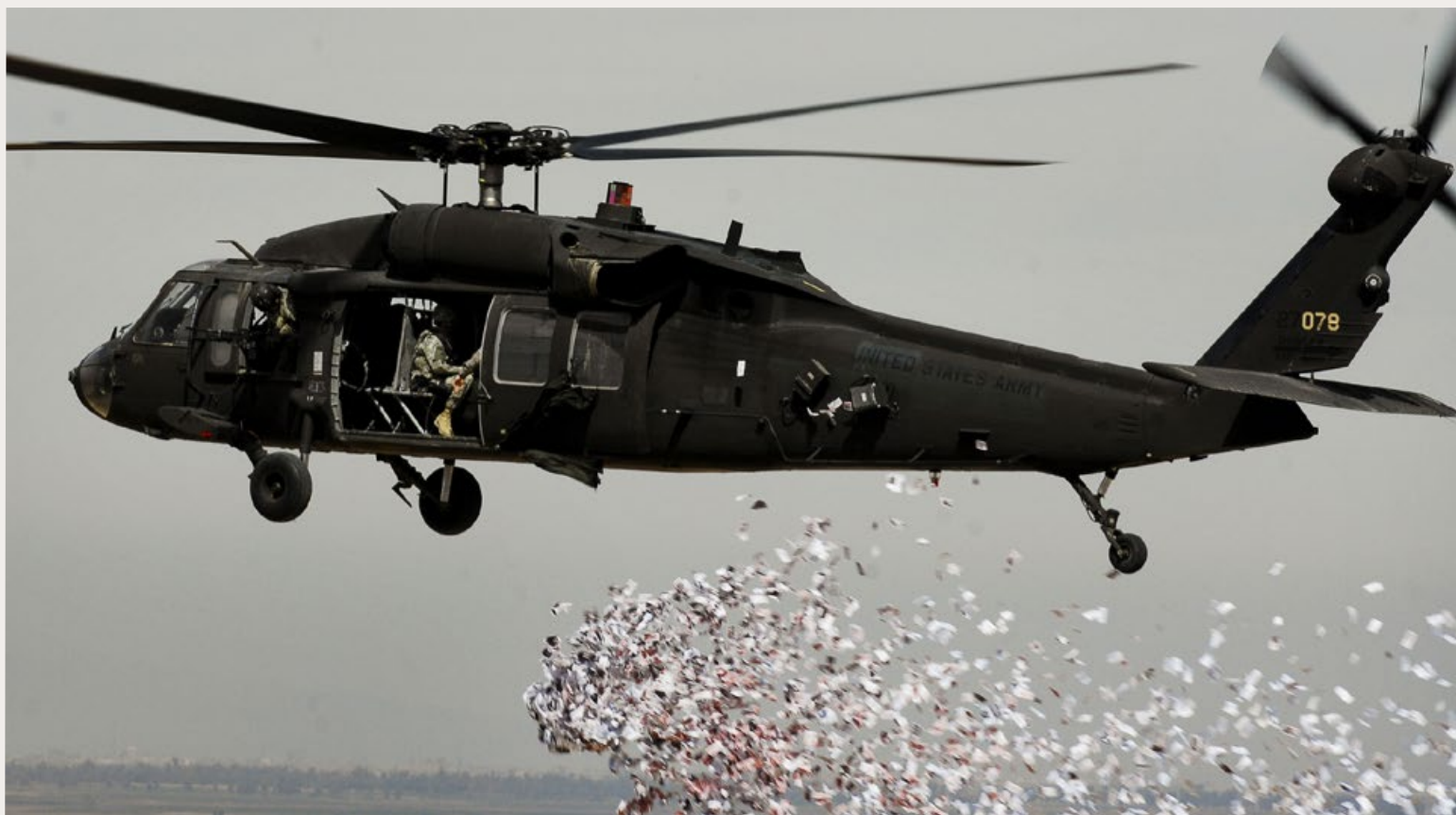
PAMFLETTEN WORDEN UITGESTORT BOVEN EEN DORP IN DE BUURT VAN HAWIJAH IN DE PROVINCIE KIRKUK, IRAK, 2008. DE PAMFLETTEN ZIJN BEDOELD OM HET IDEE VAN ZELFBESTUUR TE PROMOTEN BIJ DE INWONERS VAN HET GEBIED.

Maandenlang beheerste ISIS, of Daesh in het lokale taalgebruik, mijn wereld, want de terreurgroep had een derde van Irak in handen. Ze was tot op een tiental kilometers van mijn Koerdische woonplaats Erbil gekomen. Als correspondent volgde ik de oorlog tegen ISIS actief, maar vooral via verhalen van vluchtelingen en familieleden van degenen die onder ISIS-bezetting leefden. En van collega's die embed-