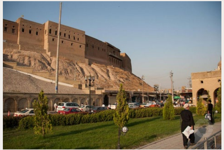
EEN GEDEELTE VAN HAWIJA

Ik zat er met dubbele gevoelens. Dat was niet alleen omdat het stempel van Hawija als terroristenhof slecht combineerde met mijn medelijden met de slachtoffers die vaak alles kwijt waren. Er was haat en woede jegens Nederland over die bom, en die richtte zich ook op mij. 'Ik haat alle Nederlanders, lei-