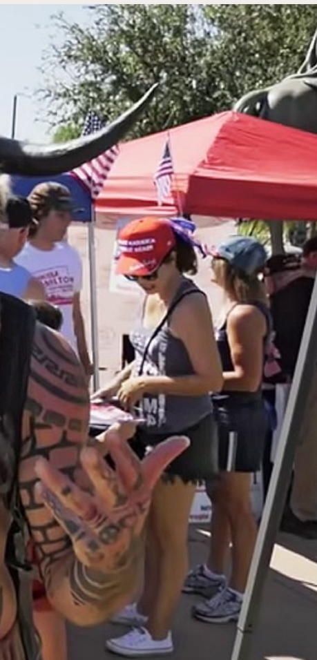
QANON-AANHANGER, SJAMAAN EN COMLOTDENKER JAKE ANGELI

'Maar het complotdenken heeft al voor corona een hoge vlucht genomen, dankzij politici die allerlei samenzweringstheorieën hebben verspreid en nog steeds verspreiden en een groot bereik hebben. Allereerst is dat natuurlijk Donald Trump, en in Nederland hebben we het over Thierry Baudet. Er zit geen rem meer op bij Baudet. Hij twijfelt nu ook over de maanlanding.'