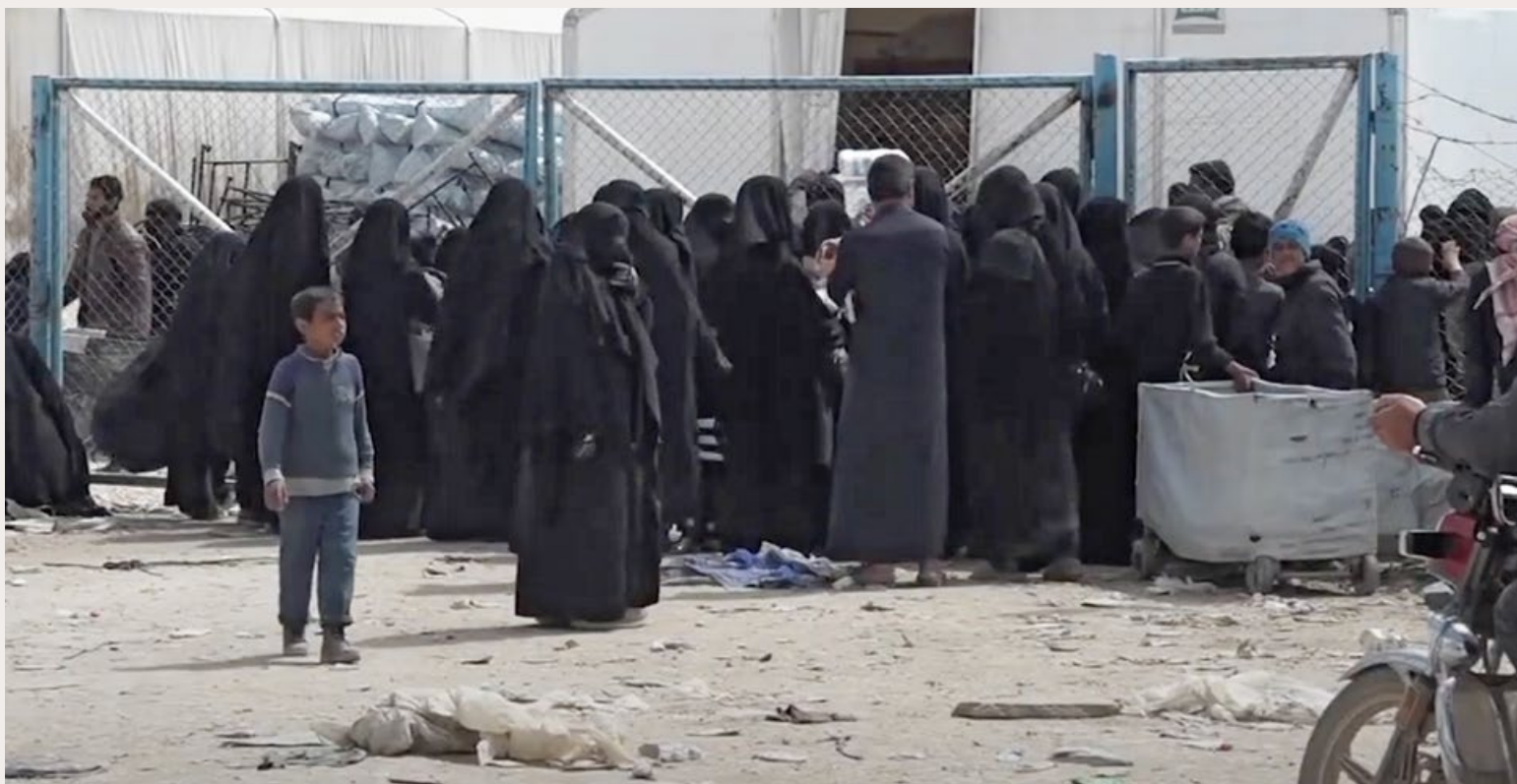
HET SYRISCHE VLUCHTELINGENKAMP AL-HOL, 2019

strafrecht in Nederland heeft als uitgangspunt dat mensen die aantoonbaar strafbare feiten plegen daadwerkelijk gestraft zullen worden. Maar er is daarnaast ook de rehabilitatie en re-integratie van deze mensen in de maatschappij. Wat betekent dat voor Nederlanders die naar Syrië zijn gegaan? Dat ze dus ook weer terugkomen, hun