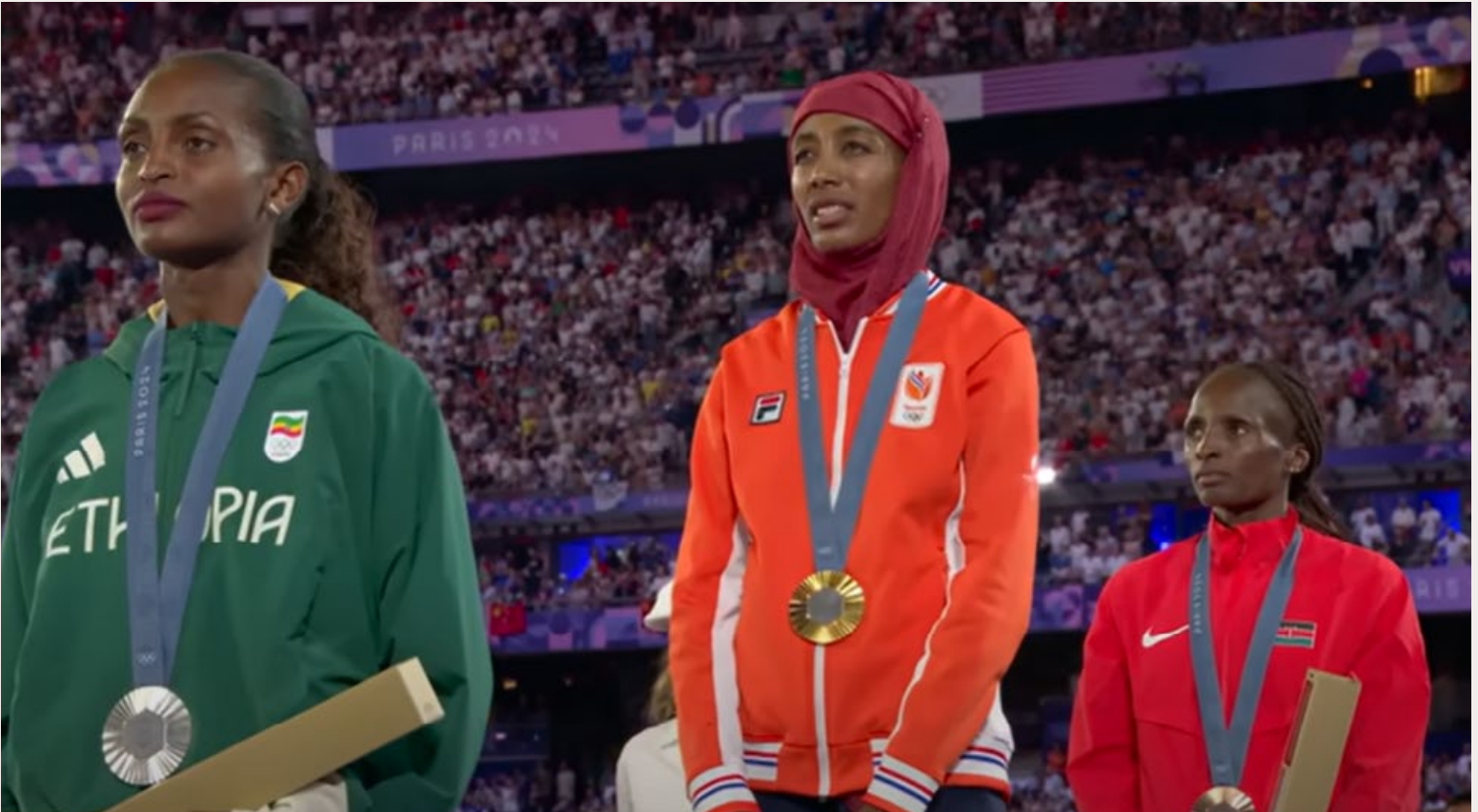
SIFAN HASSAN (MIDDEN) KRIJGT EEN GOUDEN MEDAILLE VOOR DE MARATHON OP DE OLYMPISCHE SPELEN.