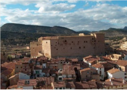
HET SPAANSE DORP MORA DE RUBIELOS BIEDT ONDERDAK AAN 110 ASIELZOEKERS UIT MALI.

De eerlijke verdeling van vluchtelingen is ook in Spanje een heet hangijzer. Eerder deze maand werden 110 vluchtelingen overgeplaatst van de Canarische Eilanden naar Mora de Rubielos, een dorp met slechts ongeveer 1.600 inwoners.