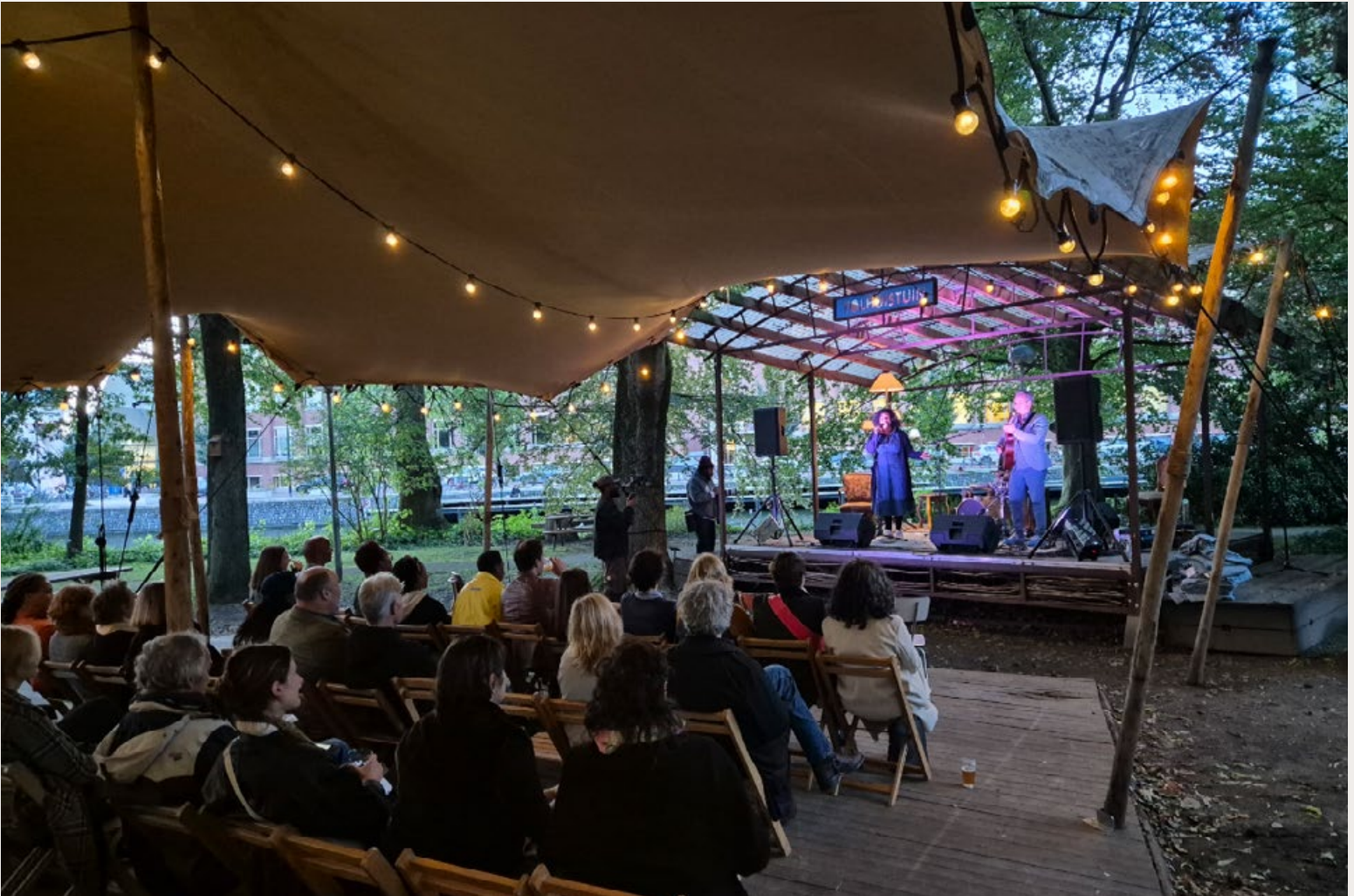
LITERAATUURFESTIVAL READ MY WORLD.

nen van het kabinet. 'Het belangrijkste is dat je vecht, je mond opentrekt.'