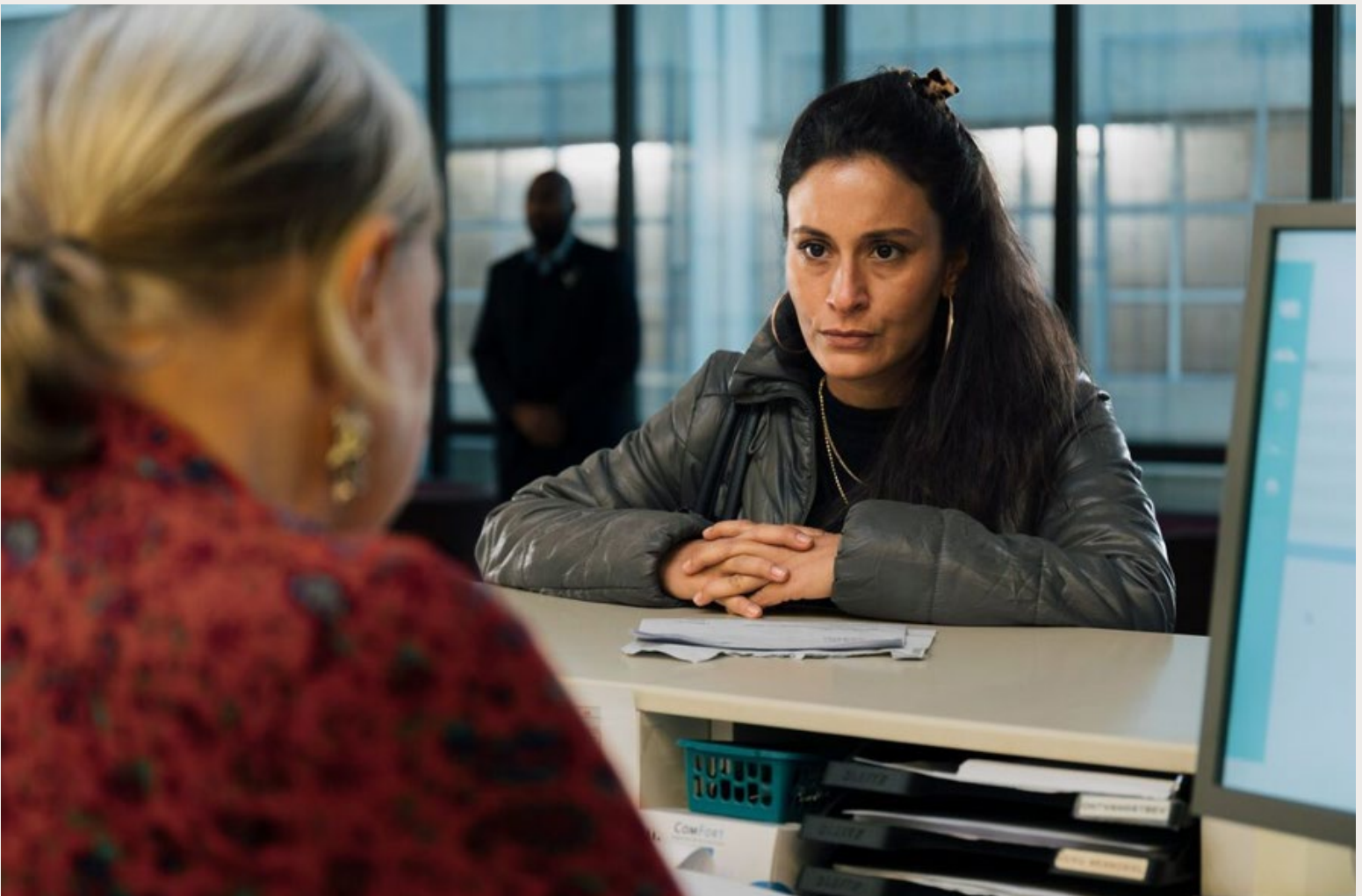
DE JACHT OP MERAL Ö.

listisch mogelijk uitbeelden. In sommige gevallen moesten we zelfs gebeurtenissen terugschroeven, omdat het haast te ongeloofwaardig overkwam. Sommige gebeurtenissen waren heftiger in het echt dan in de film.'