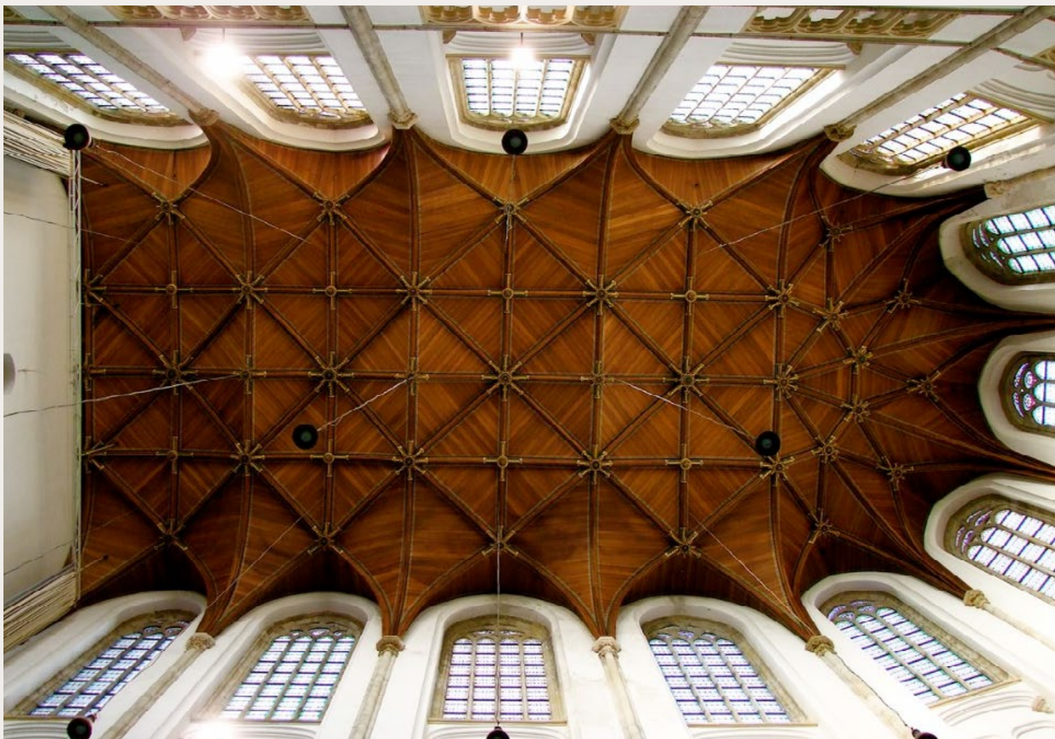
DE GROTE KERK IN DEN HAAG.

Al vijftientig jaar komen vertegenwoordigers van tien religieuze stromingen op Prinsjesdag bij elkaar om de regering een morele boodschap mee te geven. 'We willen politici helpen de juiste vragen te stellen.'