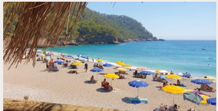
DE TURKSE BADPLAATS FETHIYE AAN DE EGËISCHE ZEE.

kost een retourvlucht naar Turkije vanuit Nederland ongeveer 700 euro, waardoor het voor gezinnen met kinderen voordeliger is om twee of drie dagen met de auto te reizen. •