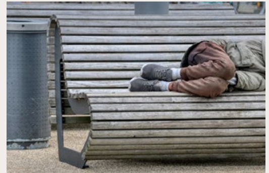
DOOR HET AFSCHEFFEN VAN DE BED-BAD-BROOD-REGELING BELANDEN UITGEPROCEDEERDE ASIELZOEKERS DIE NIET KUNNEN TERUGKEREN OP STRAAT.