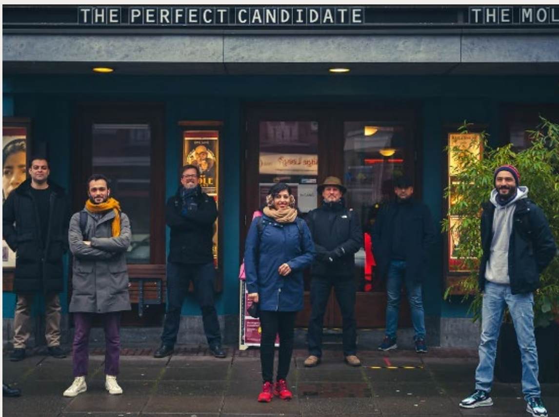
HET TEAM VAN BUDDY FILM FOUNDATION.

De Buddy Film Foundation helpt gevluchte regisseurs en acteurs op weg in de filmindustrie. 'We sturen niet zomaar iemand naar de set.'