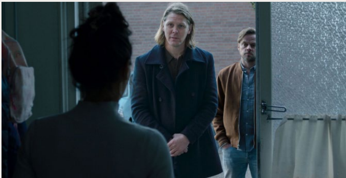
DE JACHT OP MERAL Ö.

De tweede reden is dat ik een filmische ervaring wilde maken. Ik wilde de kijker meenemen in een soort reconstructie, de verhalen tastbaar maken, tonen hoe het beleefd is door de ouders. Ik wilde het wel zo rea-