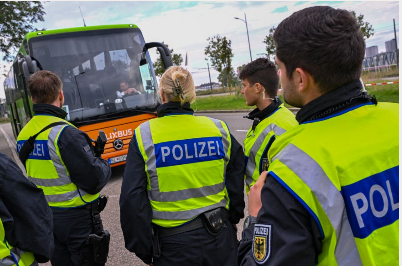
DUITSE POLITIEAGENTEN CONTROLEREN EEN BUS OP DE DUITSS-FRANSE GRENS OP 16 SEPTEMBER 2024.

Duitsland is onlangs gestart met grenscontroles om 'illegale immigratie' tegen te gaan. Moet Nederland dit voorbeeld volgen? Het vaste panel van de Kanttekening spreekt zich uit.