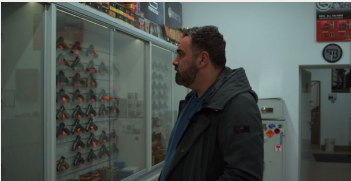
SCÈNE UIT DE WAPENROUTE.

'Ik kan er met mijn verstand niet bij dat al die wapens de wereld een stukje veiliger hebben gemaakt'