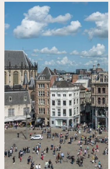
DAM IN AMSTERDAM.