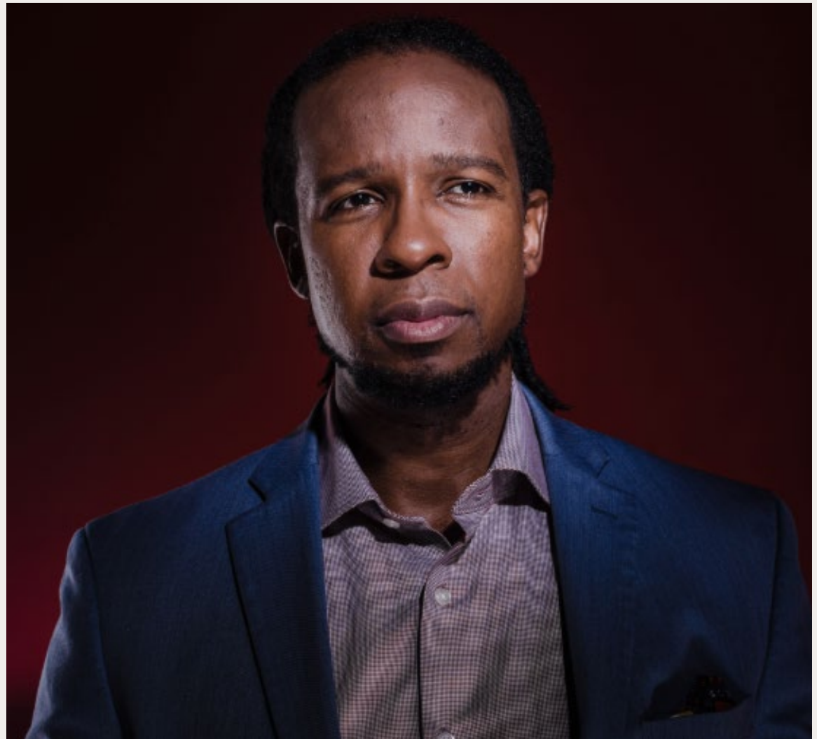
HISTORICUS EN ANTI-RACISME-ACTIVIST IBRAHIM X. KENDI

'Nee. De meeste mensen die mijn boeken lezen, zijn geen academici. Ik probeer mijn werk toegankelijk te maken en schrijf ook kinderboeken. Daarnaast werk ik aan films en sociale media-inhoud om racisme begrijpelijk te maken. Regeringen, zowel in de VS als in Nederland, voeren een strijd tegen onderwijs en promoten onwetendheid. Mijn boeken wor-