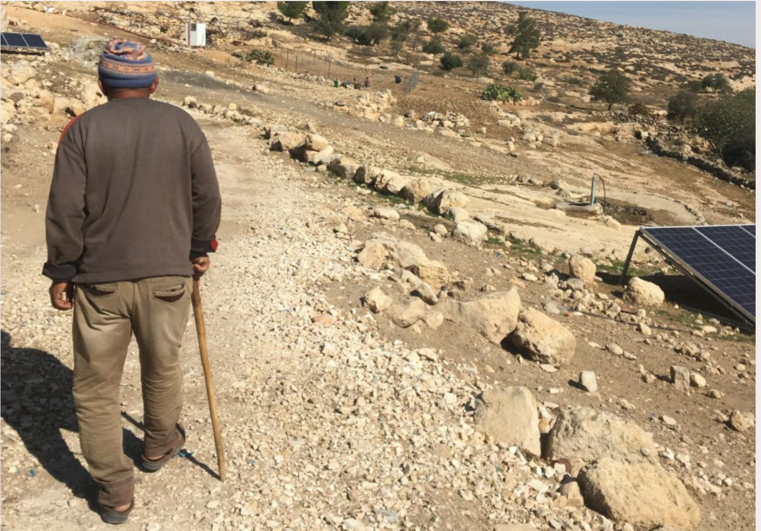
OUDE PALESTIJNSE MAN LOOPT DOOR DE HEUVELS TEN ZUIDEN VAN HEBRON OP DE WESTELIJKE JORDAANOEVER.

algemene opvatting in westerse landen dat er een tweestatenoplossing moet komen. Als de Westelijke Jordaanoever officieel wordt geannexeerd, is het de facto één staat. Waar moet die tweede staat dan nog komen?'