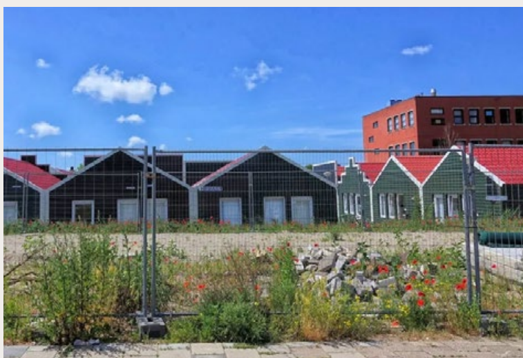
WONINGEN VOOR STATUSHOUDERS AAN DE JUPITERKADE IN DEN HAAG.

Het kabinet wil een einde maken aan het versneld toewijzen van sociale huurwoningen aan statushouders. Vluchtelingen zouden achteraan in de rij moeten aansluiten, net als reguliere woningzoekenden.