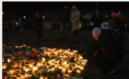
MENSEN VERZAMELEN ZICH BIJ EEN SCHOOL IN ÖREBRO, ZWEDEN, EEN DAG NADAT DAAR BIJ EEN SCHIETPARTIJ ELF MENSEN OM HET LEVEN KWAMEN.

Eerder vermeldde Trouw wél de nationaliteit van