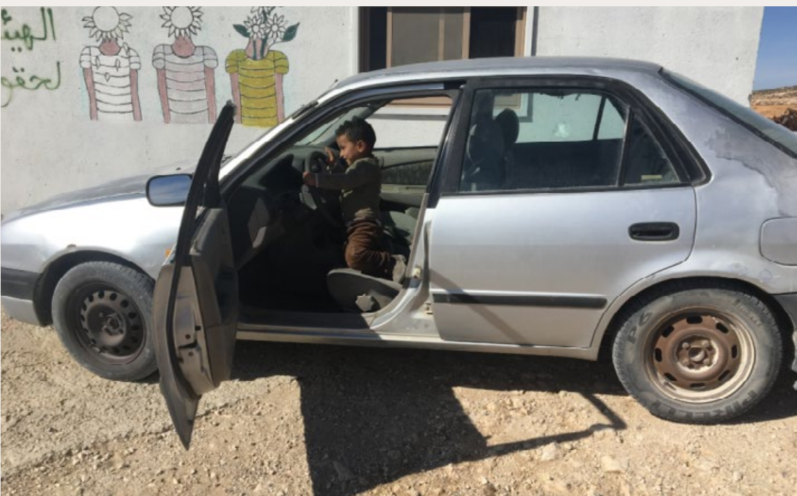
EEN KIND SPEELT IN EEN AUTO IN DE BUURT VAN HEBRON.