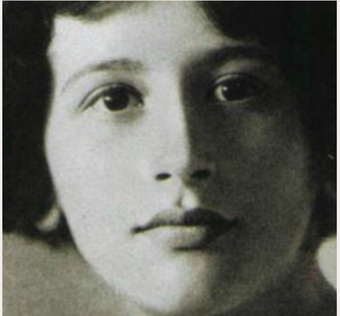
SIMONE WEIL IN 1921, 12 JAAR OUD.