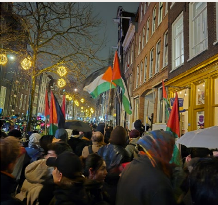
0-PALESTINADEMONSTRANTEN LOPEN NAAR DE DOMINICUSKERK IN AMSTERDAM.

Over het Palestijnse geweld waarmee Israëliërs te maken krijgen, is Albanese totaal niet verrast. 'Je kunt van mensen die beroofd worden niet verwachten dat ze hun land zomaar afstaan', zegt ze. 'Het geweld is een reactie op het koloni-