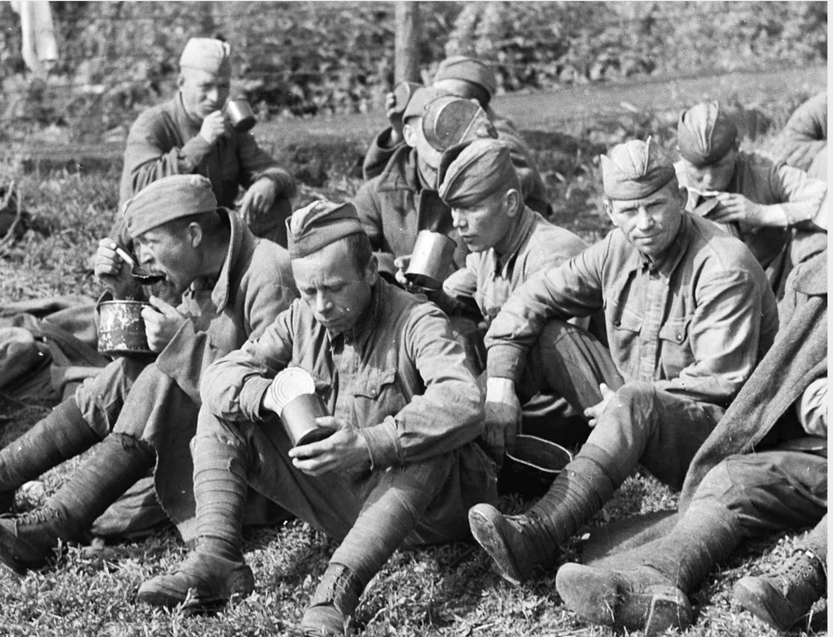
RUSSISCHE SOLDATEN TIJDENS DE TWEDE WERELDOORLOG.

nodig voor hun bedrijven, maar later ook om intern een volksopstand te voorkomen. Vestigingskolonialisme was bijvoorbeeld een effectief antwoord op de werkloosheid in Groot-Brittannië, dat haalde de druk van de ketel af. Zo verwoorde Cecil Rhodes, wellicht de meest