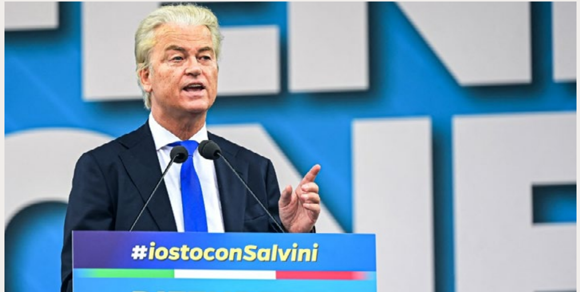
PVV-LEIDER GEERT WILDERS SPREEKT BIJ DE ITALIAANSE RADICAAL-RECHTSE LEGA-PARTIJ OP 6 OKTOBER 2024.

Een ander verschil met het sociaal-liberalisme van D66 zit in de rol