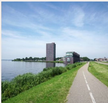
ALMERE HAVEN, 2019. BEELD: PIXABAY

De ombudsman van metropoolregio Amsterdam heeft de gemeente Almere bekritiseerd ipv het heimelijke onderzoek naar moskeeën, dat in 2021 aan het licht kwam, meldt Omroep Flevoland.