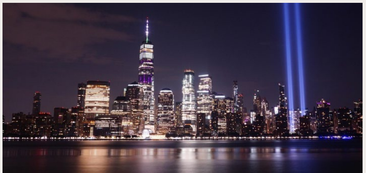
MANHATTAN MET BLAUWE LICHTSTRALLEN DIE DE PLEK VAN DE VERNIETIGDE TWIN TOWERS (WTC) MARKEREN.

Volgend jaar is het 25 jaar geleden dat deze uitspraken zijn gedaan. Laten we hopen dat de VS nog steeds een bron van stabiliteit kunnen blijven. ●