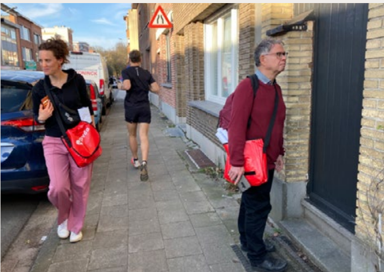
PVDA-LEDEN GAAN LANGS DE DEUREN IN ANTWERPEN.

Luisteren is geen gelijk geven. 'Hoeveel racisme wij ook ontmoet-