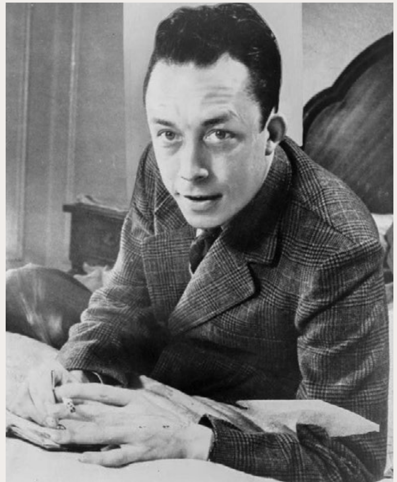
ALBERT CAMUS.