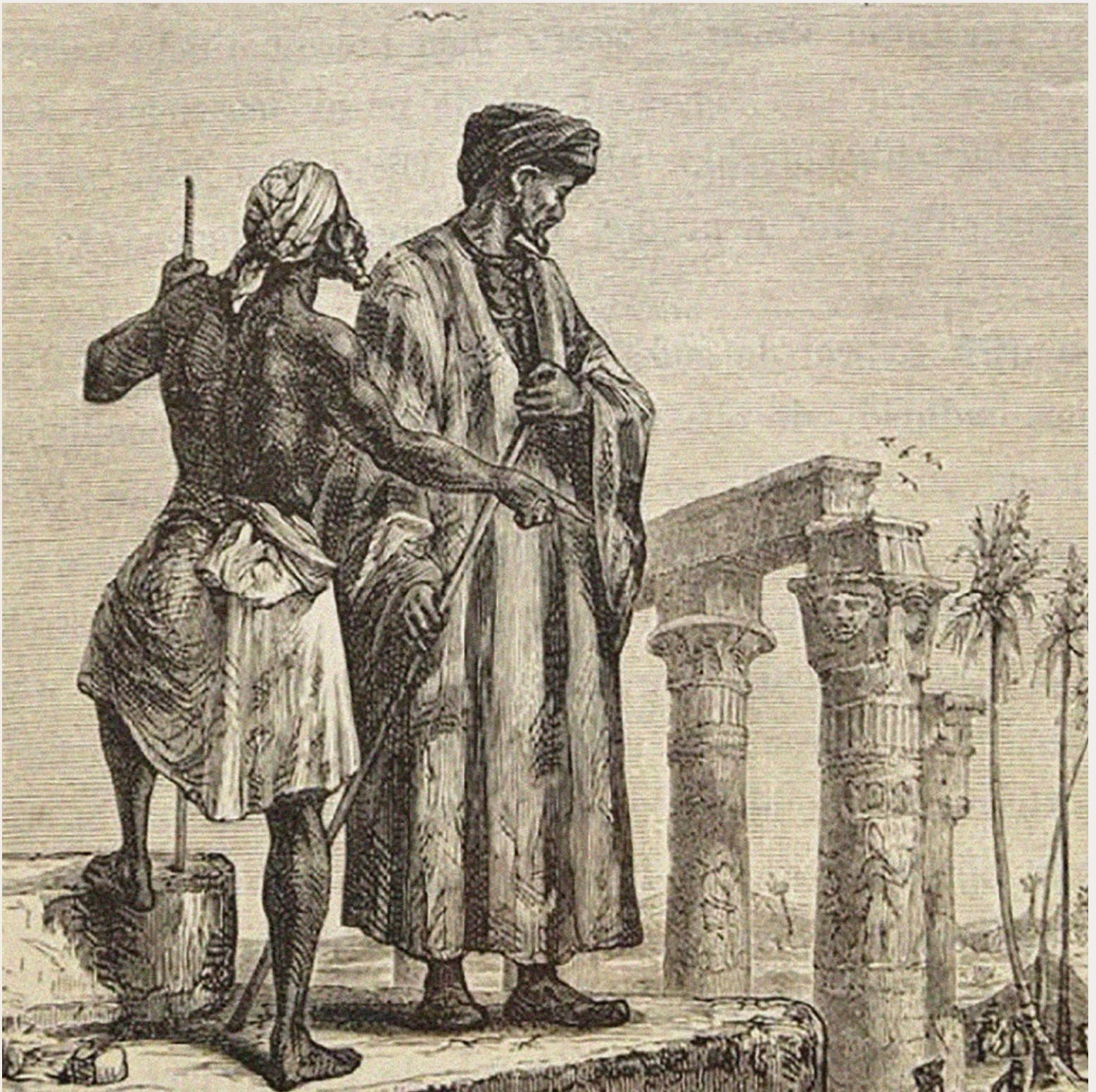
IBN BATTOETA BEZOECT EGYPTIE. TEKENING VAN LÉON BENETT IN HET BOEK 'DE ONTDEKKING VAN DE AARDE' VAN JULES VERNE.