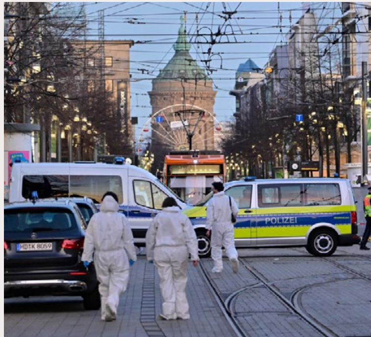
POLITIE IN DE DUITSE STAD MANNHEIM NA DE AANSLAG OP 3 MAART, WAARBIJ EEN AUTOMOBILIST TWEE MENSEN DOODDE.

'Van het allerkleinste incident — zoals dat met Lenny Kuhr destijds — werd een heel statement gemaakt vanuit de Tweede Kamer, met allerlei wetsvoorstellen, een taskforce antisemitisme, en andere draconische maatregelen. Terwijl zulke incidenten vaak ook een vorm van legitiem verzet zijn tegen de genocide in Gaza. Dit is een overheid die niet meer te vertrouwen is, en elk incident zal worden aangegrepen om de samenleving verder uiteen te drijven.' ●