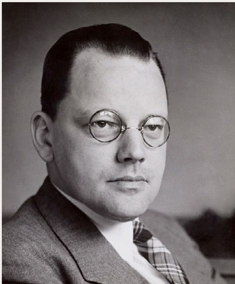
MENNO TER BRAAK IN 1939.