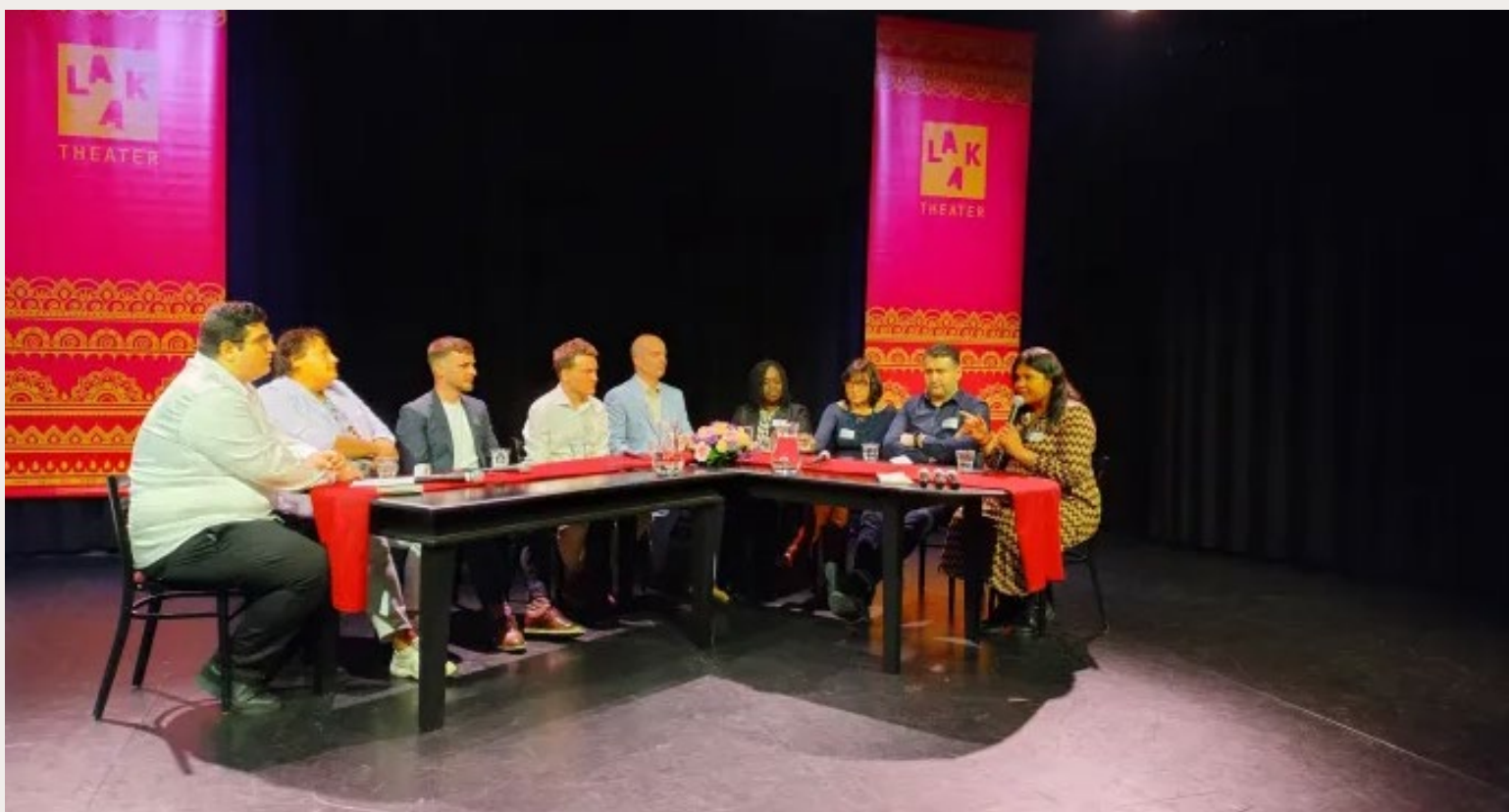
PANELGESPREK MET EXPERTS EN ERVARINGSDESKUNDIGEN.

voor de uitleenbedrijven. Deze instantie kan uitzenders ook schorsen in geval van ernstige mis-