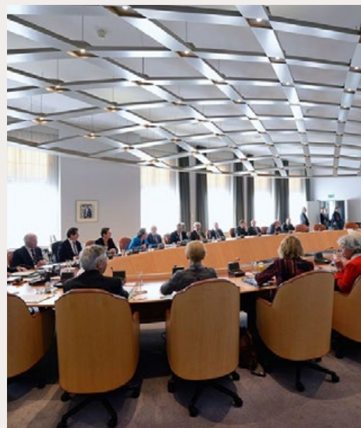
DE RAAD VAN STATE VERGADERT OP HET BINNENHOF, IN 2015.

Hij meent dat de Nederlandse democratie wordt bedreigd door politici met ‘autocratische tendensen’ die een loopje nemen met rechtsstatelijke instituties en daarom ‘weerbaarder’ moet worden gemaakt. ‘Een volwaardige democratie moet weerbaar zijn tegen uitholling van binnen en aanvallen van buiten’, adviseert hij. ●