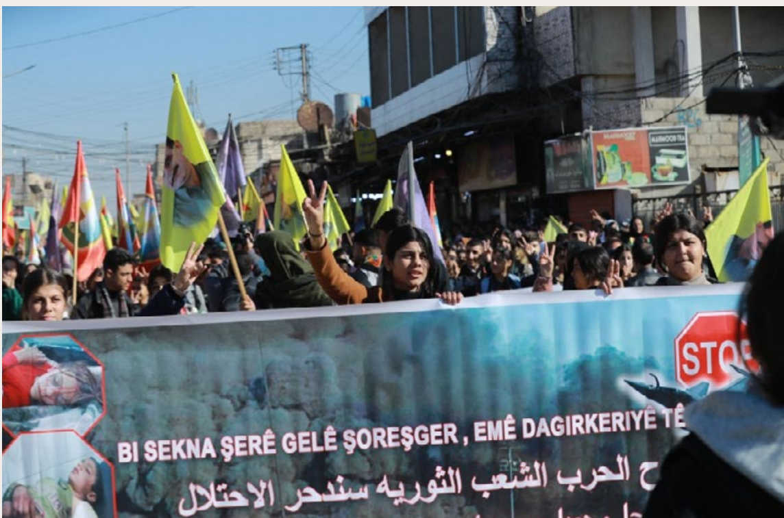
SYRISCHE KOERDEN DEMONSTREREN OP 2 DECEMBER 2024 TEGEN DE AANVALLEN VAN DOOR TURKIJE GESTEUDE STRIJDER.

In Syrië is onlangs een akkoord bereikt tussen de interim-regering en de door Koerden gedomineerde SDF. Zijn betere tijden op komst voor deze etnische groepering?