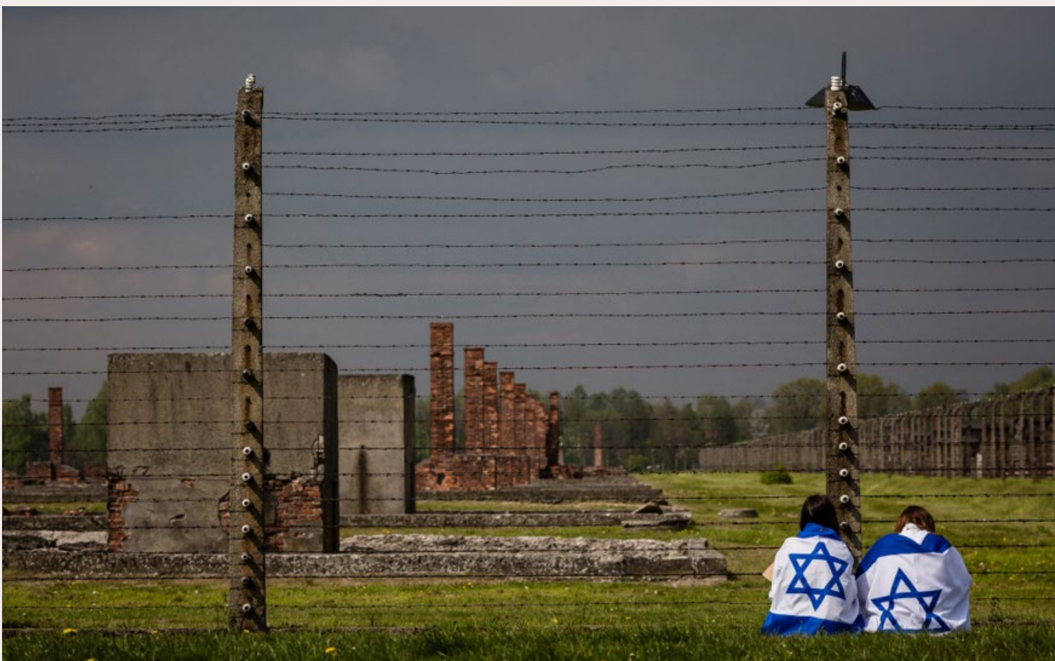
JONGE ISRAËLISCHE DEELNEMERS AAN DE JAARLIJKSE MARS VAN DE LEVENDEN ZITTE IN HET GRAS OP HET TERREIN VAN HET VOORMALIGE CONCENTRATIEKAMP AUSCHWITZ-BIRKENAU, OP 5 MEI 2016.

Israëliërs leven sinds de aanval van Hamas op 7 oktober in constante spanning. 'Palestijnse burgers... Waar heb je het over? We vechten tegen nazi's.'