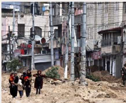
PALESTIJNEN VLUCHTEN TERWIJL ISRAËLISCHE SOLDATEN OP 10 FEBRUARI HET VLUCHTELINGEKAMP NUR SHAMS OP DE BEZETTE WESTOEVER BINNENVALLEN.

De Israëlische regering heeft officieel aangekondigd de Westelijke Jordaanoever volledig te willen annexeren. Dat staat in een verklaring van het ministerie van Defensie. Mensenrechtenorganisaties en internationale experts slaan alarm.