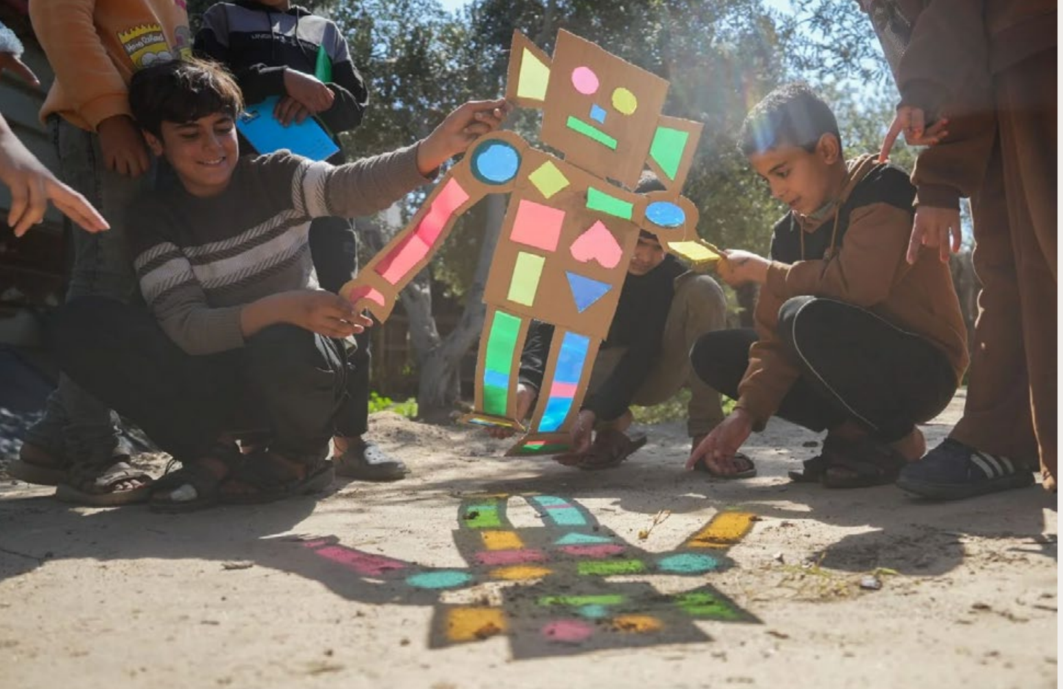
PALESTIJNSE JONGENS LATEN EEN KNUTSELWERKJE ZIEN.

‘Ik heb zo veel kinderen gehoord die zeiden: ik wil ook dood’