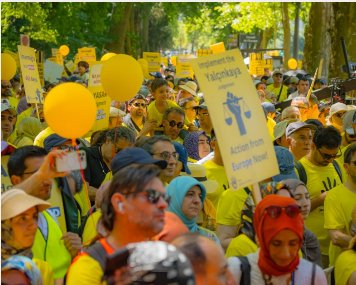
DUIZENDEN GÜLEN-SYMPATHISANTEN DEMONSTREREN IN STRAATSBURG.

Duizenden gülenisten, in gele hesjes, met gele borden en gele ballonnen, demonstreerden woensdag in Straatsburg bij de Raad van Europa. Ze willen dat de Raad meer druk uitoefent op Turkije om alle politieke gevangenen, niet alleen de gülenisten, vrij te laten.