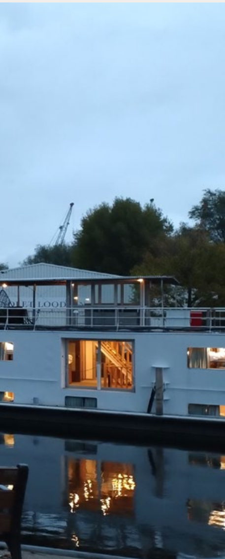
ASIELZOEKERSBOOT IN SCHIEDAM.

de vraag of de nieuwe regels ook voor haar zullen gelden, rolt er een traan over haar wang en zegt ze zachtjes 'ja', schreef ze vorige week op LinkedIn.