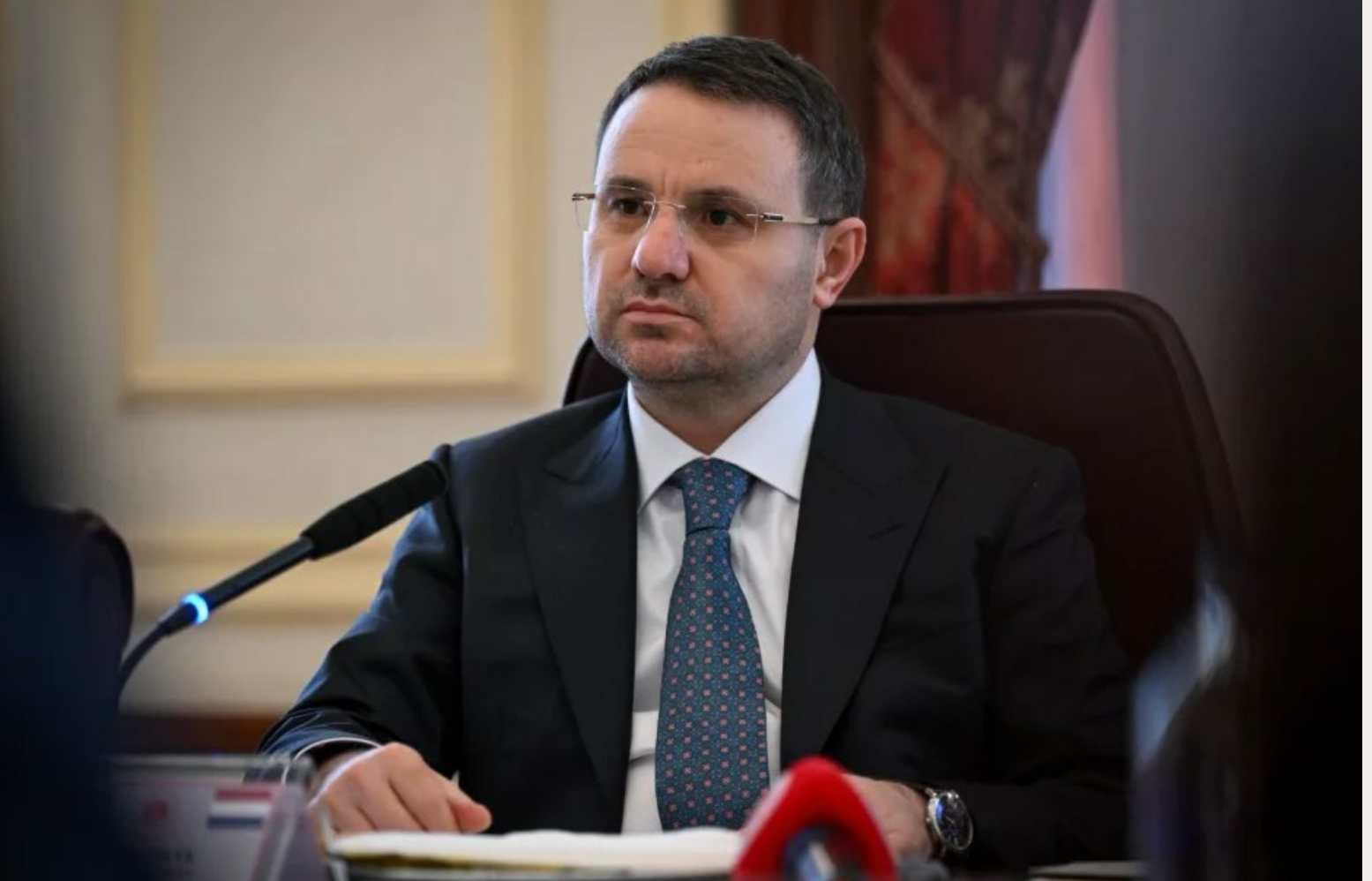
AKIN GÜRLEK, MINISTER VAN JUSTITIE IN TURKIJE, OP 2 APRIL 2026.

‘Net als eerdere ministers is hij vooral een instrument van Erdogan’