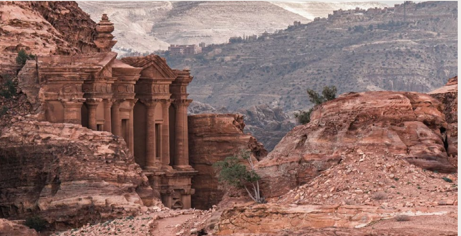
DE GEVEL VAN AD DEIR, HET KLOOSTER, EEN UIT DE ROTSEN GEHOUVEN BOUWWERK IN DE OUDE STAD PETRA IN JORDANIË.