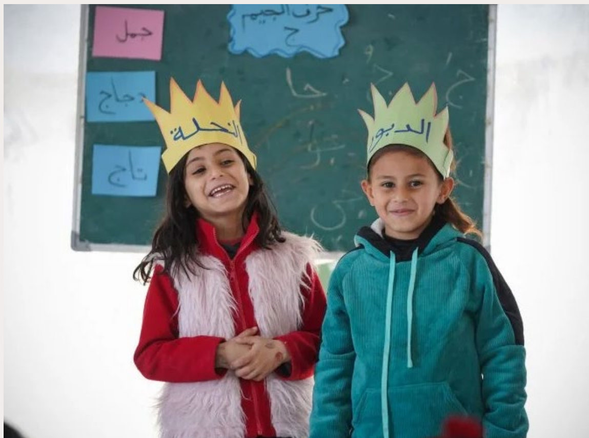
PALESTIJNSE MEISJES DOEN MEE MET EEN ACTIVITEIT VAN RIGHT TO PLAY

'De Intifada heeft me doen realiseren wat oorlog en conflict doen met een kind'