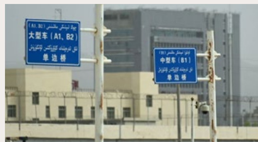
OP DE ACHTERGROND STAAT WAARSCHIJNLIJK EEN DETENTIECENTRUM VOOR OEIGOEREN IN XINJIANG, CHINA, 19 JULI 2023.

In de afgelopen jaren zijn de betrekkingen tussen Nederland en China complexer geworden. Enerzijds is er een groeiende economische samenwerking, met China als een belangrijke handelspartner voor Nederland. Anderzijds zijn er zorgen over mensenrechten en de invloed van China op de Nederlandse politiek en samenleving. •