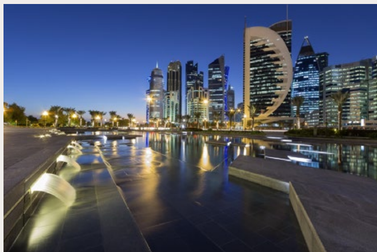
DE SKYLINE VAN DOHA, DE HOOFDSTAD VAN QATAR.

Oxfam Novib over Zuidwest-Azië, omdat deze benaming de regio geografisch beschrijft zonder Europa als middelpunt te nemen. Met deze keuze dragen we bij aan zorgvuldiger en inclusiever taalgebruik.’ ●