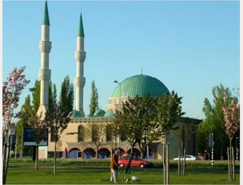
DE MEVLANA-MOSKEE IN ROTTERDAM KREEG ONLANGS TE MAKEN MET VERNIELINGEN.