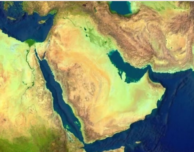
HET GEBIED DAT WORDT AANGEDIJD ALS HET MIDDEN-OOSTEN.