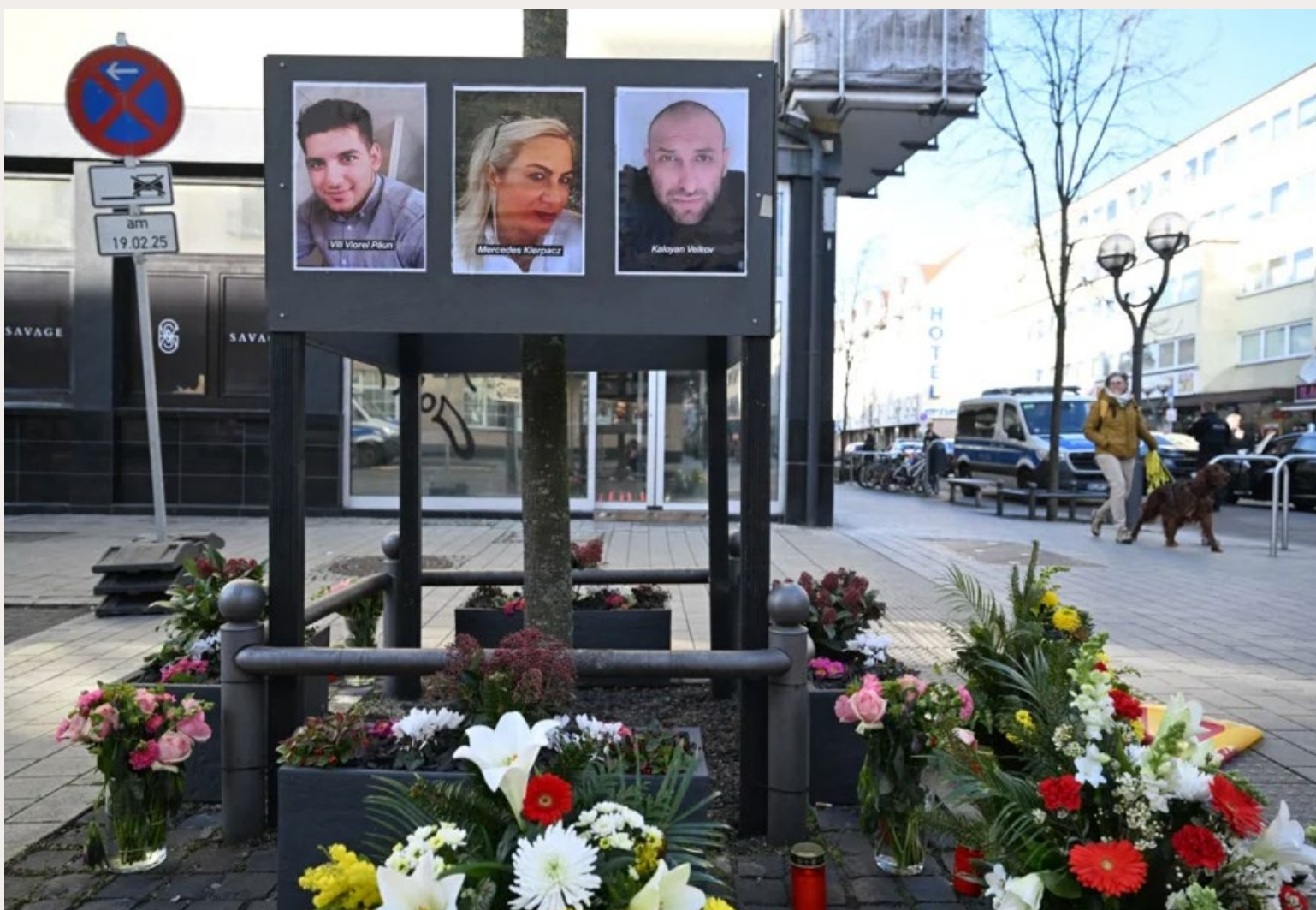
MONUMENT VOOR DE RACISTISCHE AANSLAG IN HET DUITSE HANAU, WAARBIJ IN 2020 NEGEN MENSEN OM HET LEVEN KWAMEN.