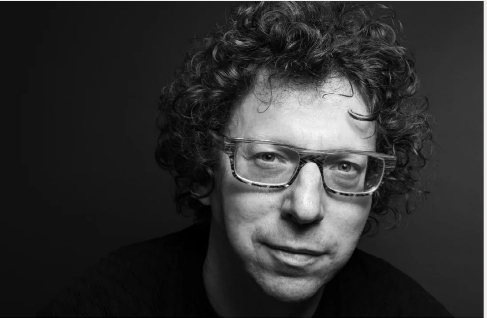
ARNON GRUNBERG

Als je kijkt naar het Oude Testament (het boek van het jodendom, red.), zie je een andere nadruk. Daar gaat het veel meer over het hier en nu. Over hoe mensen samenleven met God en met elkaar. Het gaat om praktische voorschriften en om het dagelijkse leven. Wat je moet eten, wanneer je moet rusten, hoe je moet oogsten, hoe je moet bidden.