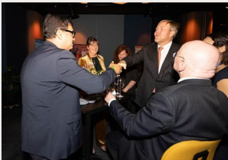
KHALED CHOUKET BEGROET KONING WILLEM-ALEXANDER

Zijn de westerse waarden 'joods-christelijk'? Geloof u daar